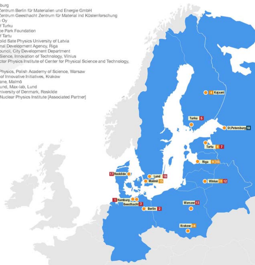
Abb. 1: Partner des SCIENCE LINK-Projekts